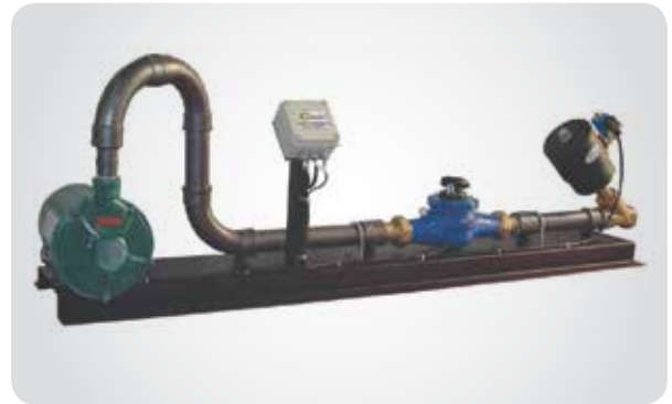
Sistema de dosagem de água para central de artefatos e pré-moldados de concreto.

El dosificador de agua para fábrica tiene mayor potencia y capacidad de vaciamento. Su capacidad fue dimensionada para ser compatible con el tiempo de abastecimiento de los agregados y del cemento, proporcionando más agilidad en las fábricas para camión hormigonera.