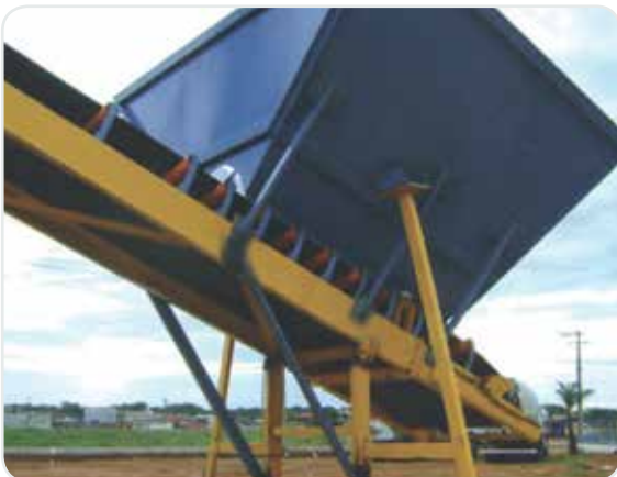
Esteira alimentadora para silos agregados. Feed conveyor for aggregate silos. Cinta alimentadora para silos de agregados.