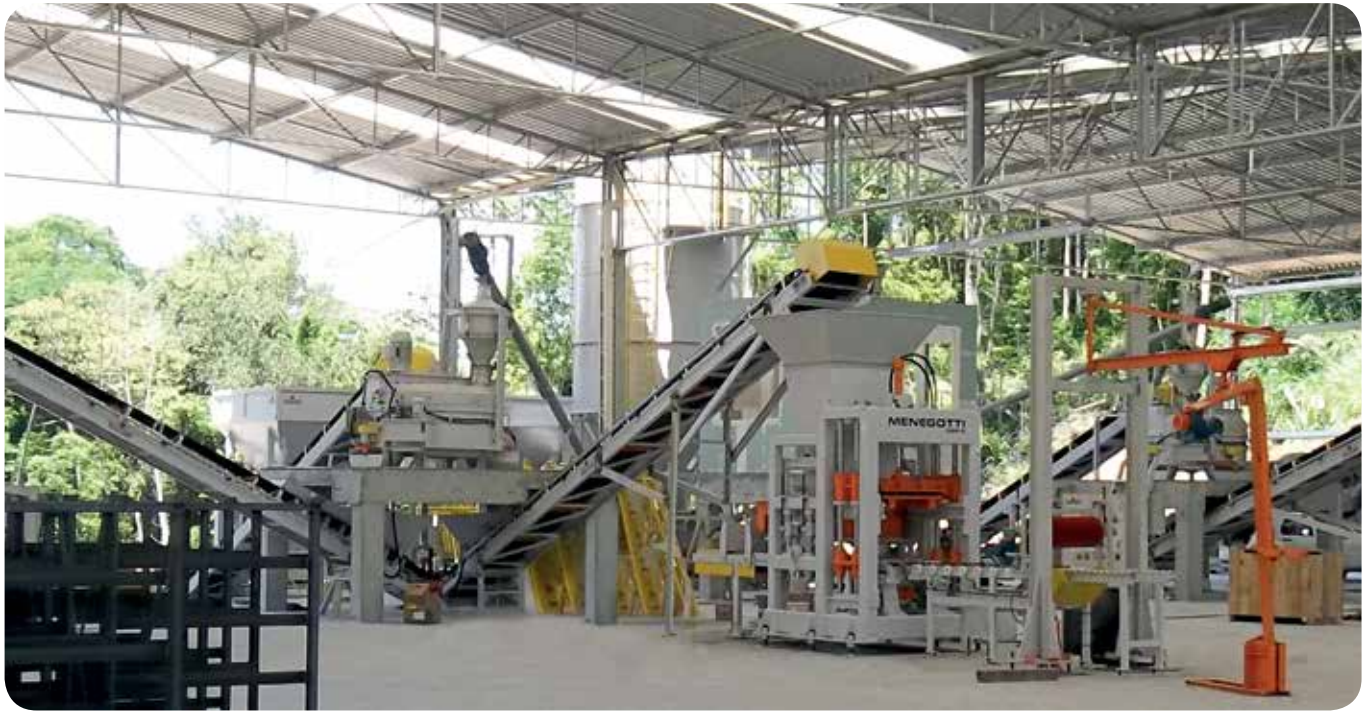
Central de Concreto para Produção de Artefatos e Pré-Moldados. | Batching Plant for Artifacts and Pre-Cast Parts. | Central en Hormigón para Artefactos y Pre-Moldeado.