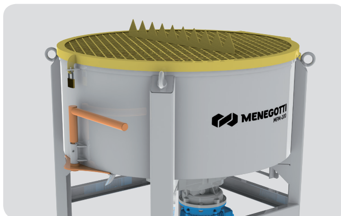
Abertura e fechamento da comporta manual.

Manual opening and closing of discharge gate.