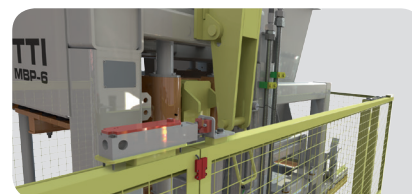
Cercas de proteção. Protection cage. Cercas de protección.

Peças de reposição | Spare parts | Piezas de repuesto