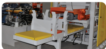
Introdutor de paletes automático. Automatic pallet feeder. Introdutor de pallets automático.