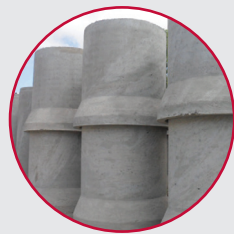
Tubos de concreto Concrete pipes Tubos en concreto

Equipamento destinado à fabricação de tubos de concreto armados e não armados, de Ø200 mm à 1.500 mm x 1.000 de altura com encaixes tipo MF 1) e PB 2) (ou 1.500 mm de altura com encaixe PB 2) ) equipados com molde externo, molde interno, molde superior, funil auxiliar e motor.